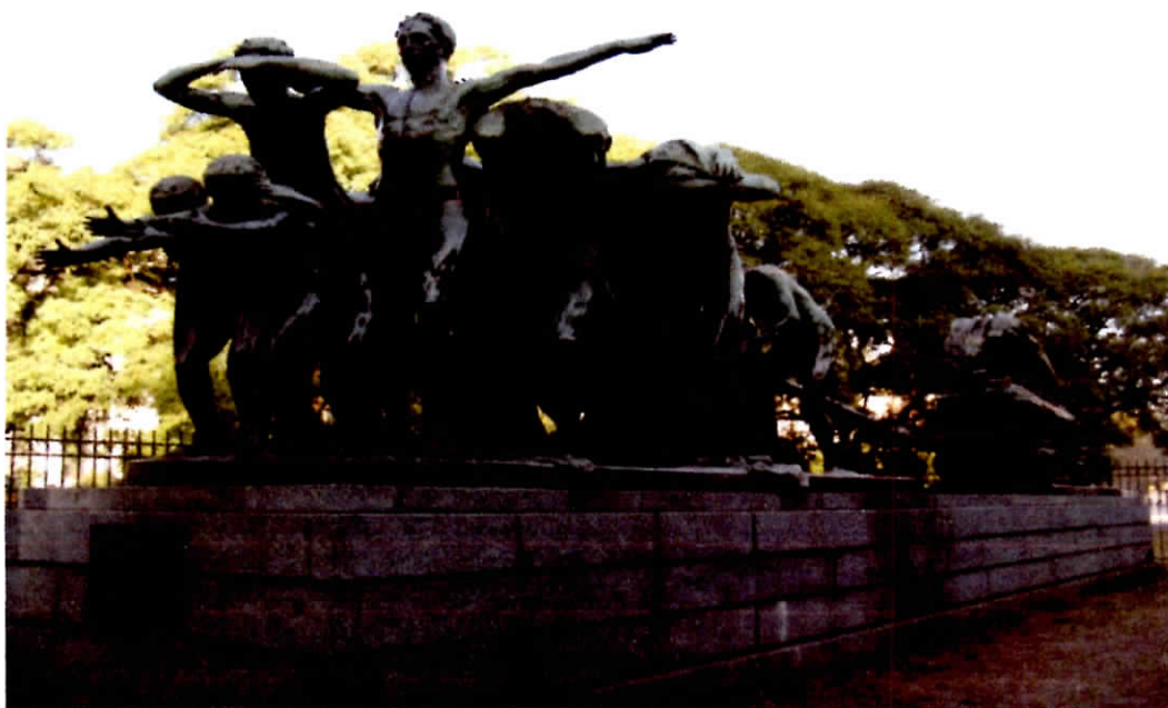
Canto al Trabajo de Rogelio Yrurtia (1879 – 1950 en Buenos Aires )